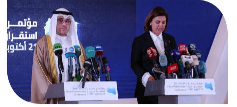
الديوان - وال

أكد البيان الختامي لمؤتمر دعم استقرار ليبيا التزام حكومة الوحدة الوطنية الدائم والثابت والقوي بسيادة ليبيا واستقلالها وسلامتها الإقليمية ووحدتها الوطنية، ورفضها القاطع للتدخلات الأجنبية في الشؤون الليبية، وادانتها لمحاولات خرق حظر السلاح وإثارة الفوضى في ليبيا والتزامها بتنفيذ قرارات مجلس الأمن بشأن ليبيا ومخرجات مؤتمر برلين (1) و(2) وخارطة الطريق الصادرة عن ملتقى الحوار السياسي الليبي.