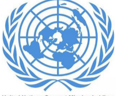
بعثة الأمم المتحدة للدعم في ليبيا United Nations Support Mission in Libya

أعلنت بعثة الأمم المتحدة للدعم في ليبيا يوم الإثنين الماضي، عن عقد الاجتماع الثاني للجنة القانونية التابعة للملتقى الحوار السياسي عبر الاتصال المرئي، بحضور المبعوثة بالإناية ستيفاني وليامز.