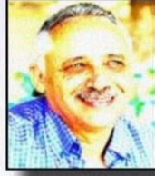
■ بقلم: الصديق ابريك بودوارة

هذا عدد مميز، لا أريد أن أتغزل فيه بمجلة الليبي، فقد فعلت ذلك كثيرا، ولا أريد أن أكتب عن البدايات، فقد كتبت عنها أكثر من مرة، ولا أريد أن أتباهى بروعة الانجاز، فقد سبق أن تباهيت.