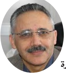
■ بقلم: الصديق ابريك بودوارة