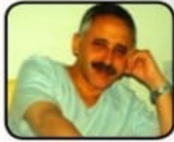
بقلم : رئيس التحرير