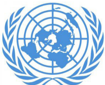
بعثة الأمم المتحدة للدعم في ليبيا

عن استكمال اللجنة العسكرية المشتركة مناقشاتها مع بعثة الأمم المتحدة بشأن المتطلبات اللازمة لإرسال مراقبي الأمم المتحدة لدعم آليات مراقبة وقف إطلاق النار والتحقق منها.