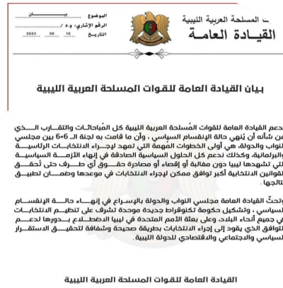
القيادة العامة للقوات المسلحة الليبية

أعلنت القيادة العامة للقوات المسلحة، دعمها لكل المباحثات والتقارب الذي شأنه أن يُنهي حالة الإنقسام السياسي، مؤكدة أن ما قامت به لجنة الـ 6+6 هي أولى الخطوات المهمة التي تمهد لإجراء الانتخابات الرئاسية والبرلمانية، وأعربت القيادة العامة في بيان لها، عن دعمها، لكل الحلول السياسية الصادقة في إنهاء الأزمة السياسية التي تشهدها ليبيا دون مغالبة أو إقصاء أو مصادرة حقوق