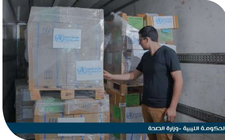
الحكومة الليبية - وزارة الصحة

أرسلت وزارة الصحة بالحكومة الليبية يوم أمس الأحد، شحنة إمدادات طبية؛ لمساعدة أهالي مدينة غات وضواحيها المتضررين من السيول والفيضانات. وتشمل الشحنة - التي تم نقلها عبر مطار بنينا - معدات وإمدادات طبية أساسية، بالإضافة إلى أدوية ضرورية، وذلك في إطار تعزيز قدرات النظام الصحي في المنطقة الجنوبية الغربية لمواجهة الظروف الصحية الطارئة. وأكدت وزارة الصحة في بيان لها، التزامها بتقديم خدمات الرعاية الصحية الكاملة في المنطقة، مع الحرص على توفير الدعم اللازم لضمان حصول جميع المواطنين على الخدمات الطبية المطلوبة.