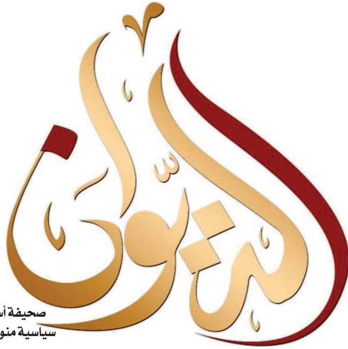
صحيفة أسبوعية سياسية متنوعة شاملة