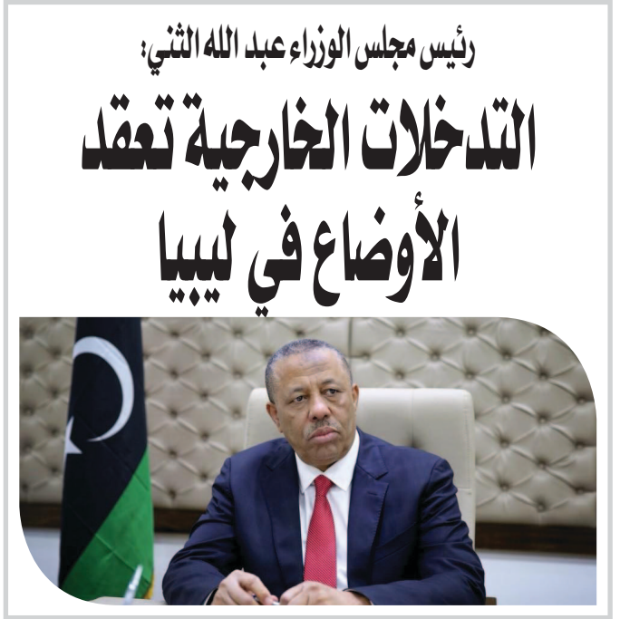
رئيس مجلس الوزراء عبد الله الثاني: التدخلات الخارجية تقف الأوضاع في ليبيا