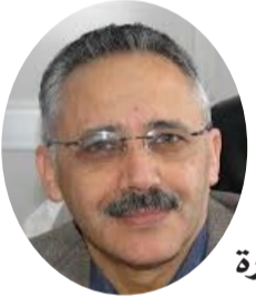
■ بقلم: الصديق ابريك بودواره

بعد منتصف الليل، أقلت أبواب المحل التجاري الكبير، غادر جميع العاملين ماعدا ثلاثة حراس تكوموا قرب المدخل الرئيس، عتمة يكسرها ضوء خافت، ارتصفت العلب، والأكياس على الأرفف، فجأة قالت علب الطماطم بصوت خافت، تخاطب علبه التن التي على الرف المقابل : - صداع قوي، يكاد يفجر رأسى . قالت علبه التن : - لا يلبث أن يزول . - لا أعرف متى يتوقف آلة التسعيرة تتقرني في اليوم عشرات المرات . تتأيت علبه شيكولا النوتبلا : - كفا عن الثروة، أريد أن أنام . - نامي في العسل، أنت منعمة، أصبح ثمنك باهظا، تلامسك أفواه الأثرياء . - اسمعي يا علبه الطماطم، الأشياء مقامات تدخلت علبه التن : - هذا غرور . علقت علبه الطماطم : - الغرور مقبرة النوتبلا . تحدثت كيس الفول السوداني : - اسمعوا، لاشيء يدوم على حاله، أنا مثلا، منذ سنوات مضت لم يلتفت إلي أحد، عزفت الناس عني، استحووا من اختياري ضمن خلوط أفراحهم، اللوز، الفستق، البندق احتلوا الصدارة، أما اليوم رد لي اعتباري، أحتل حاليًا مكان اللوز حسب سعره القديم، دعوا النوتبلا تتباهى هذه الأيام .