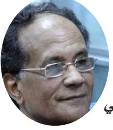
■ بقلم: محمد المسلاتي